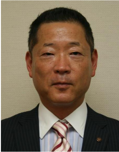
京都府 副知事 城福 健陽氏（じょうふく たけはる）

京都大学経済学部卒業。1988年運輸省（現国土交通省）入省。国土交通省港湾局企画官、経済産業省大臣官房参事官、総合政策局公共交通政策部交通支援課長、大臣官房参事官（航空局併任 近畿圏・中部圏空港担当）を経て2015年7月より現職。