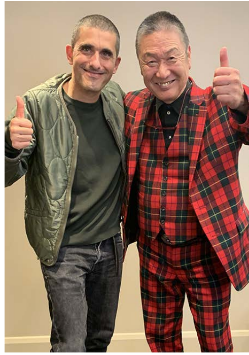
2019年10月 ロンドンにて

これは賢三さんも寛斎さんも、着やすさや着心地を常に考慮した服作りをされていたからです。そして、二人の作品が放つ、ファッションは全ての人たちのために、という精神も引継ぎたかったという思いからです。