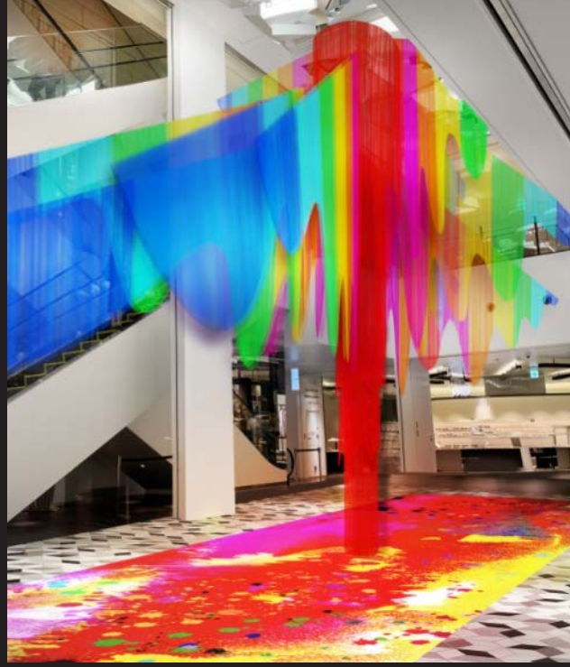
7階イベントスペース「L×7(エル バイ セブン)」イメージパース

十人十色という言葉のように、ひとり一人の持つ「色」によって生み出された「個性」が花開き、多様な価値観が尊重されることで渋谷の街がいっそう彩り豊かなことを願って、カラフルなインスタレーションをデザインしました。人々の社会生活の在り様が一変し、今までとは異なる状況で迎える今年のクリスマスですが、『美しい色は人を元気にする』という山本寛斎の世界観で、渋谷から「元氣」をお届けします!